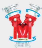
HAI CHẠC/ 2 PINS Model: 21-3VNI-65A Vật liệu/Material: Hợp kim nhôm/ Aluilum