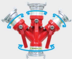
BA CHẠC/ 3 PINS Model: 21-2VNI-65A Vật liệu/Material: Hợp kim nhôm/ Aluilum