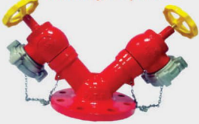
Outdoor fire Hydrant